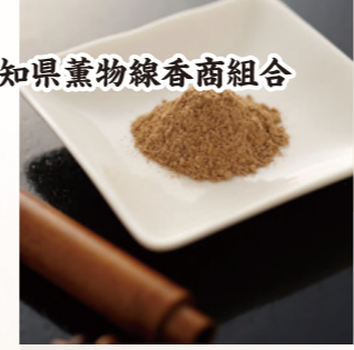
愛知県薫物線香商組合